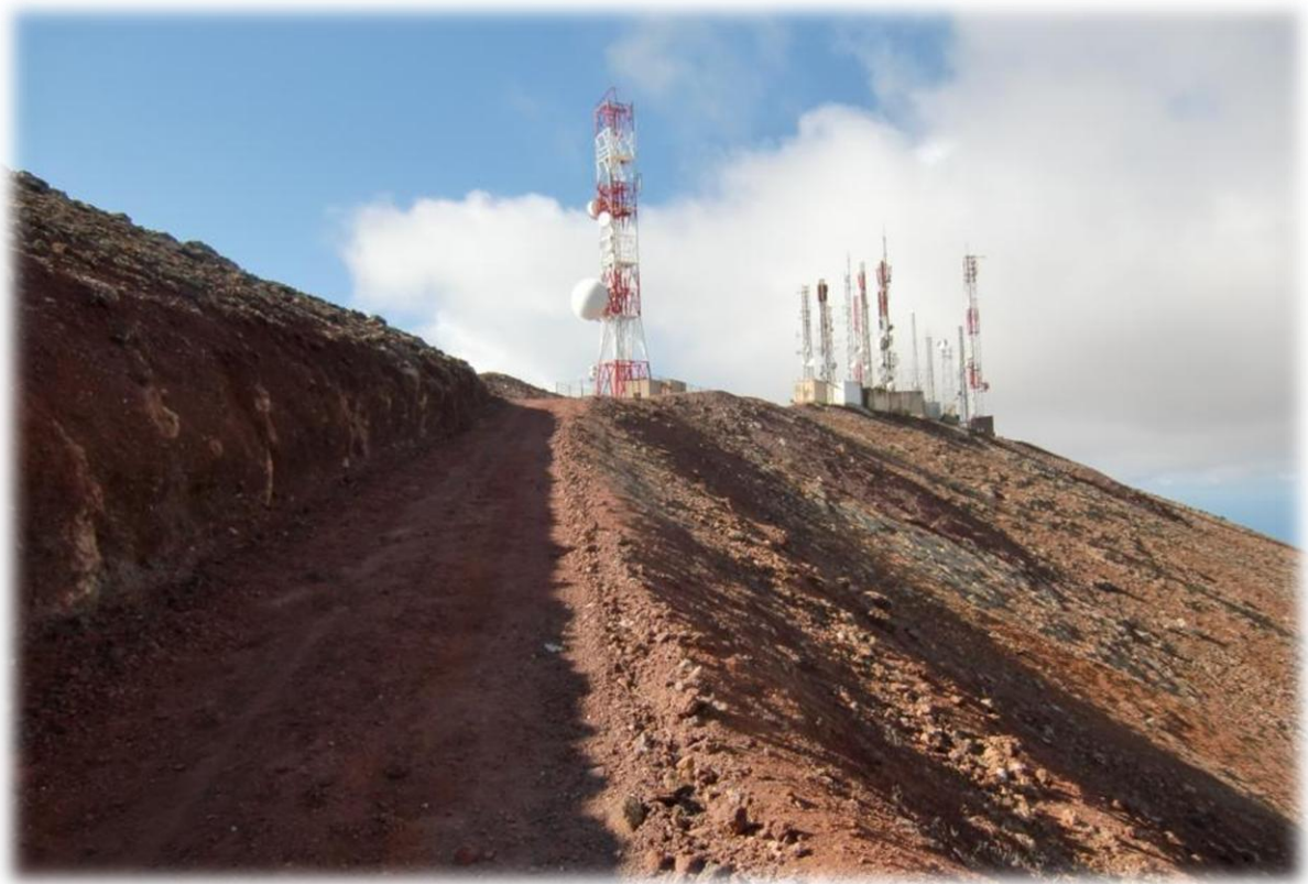
Op het hoogste punt van deze stapdag staan een heleboel antennes en zendmasten.